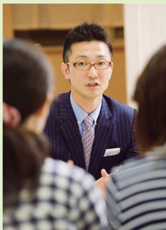
株式会社ホームスター 代表取締役 リコプラス合同会社 代表社員